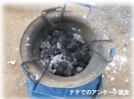
テテでのアンケート調査

“BCBを使用／購入したいですか??” YES!!・・・94% NO!!・・・4%