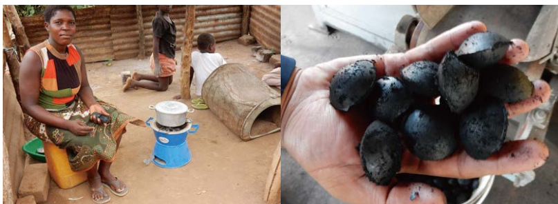
バイオコールブリケット