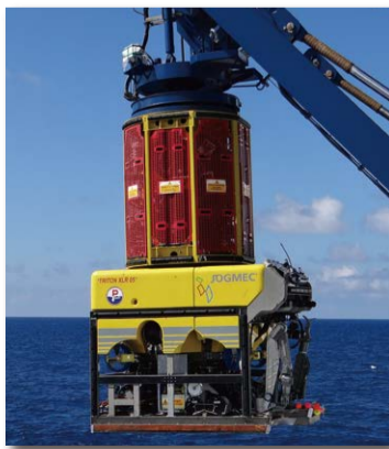
有索式無人潜水艇(ROV)