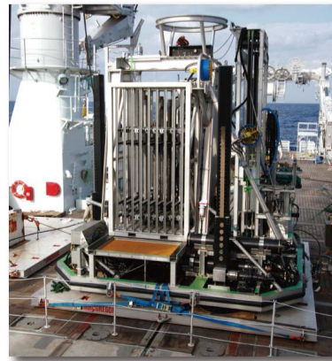
海底着座型掘削装置(BMS)