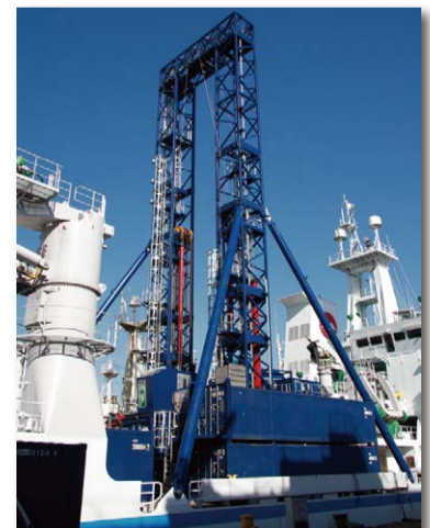
船上設置型掘削装置